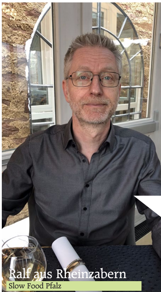
Ralf aus Rheinzabern Slow Food Pfalz

Bei Slow Food in der Pfalz versuchen wir durch verschiedene Veranstaltungen unser Motto „Gut, Sauber, Fair“ bewussten Verbraucher*innen näher zu bringen. Dazu gehören u.a. Bildungsveranstaltungen, kulinarische Wanderungen und gemeinsames Kochen. Bei regelmäßigen (virtuellen) Treffen plant ein Kernteam von engagierten Mitgliedern Events und andere Aktivitäten um unsere Vision einer guten, fairen und klimafreundlichen Ernährung voranzubringen. Als Mitglied im Genussführerteam sind regelmäßige Besuche in Restaurants, bei denen ich immer die Herkunft der Produkte hinterfrage, ein Teil der ehrenamtlichen „Arbeit“. Das so entstandene Buch ist ein schöner Wegweiser zu guten Gasthöfen – für Einheimische und Tourist*innen gleichermaßen.