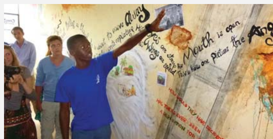
Eröffnung des Creative History Room