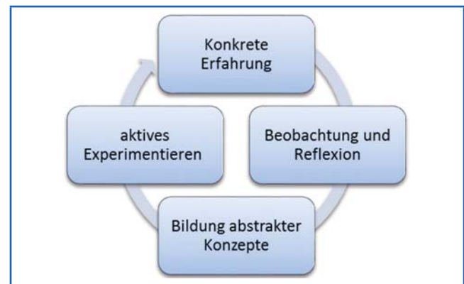
Der erfahrungsbasierte Lernzyklus nach David A. Kolb

werden sollten; dass sie während der Begegnung Orientierungshilfe erhalten; und dass sie nach der Begegnung die Möglichkeit zur Reflexion ihrer Erlebnisse bekommen, so dass sie Konzepte entwickeln und verbalisieren können, was sie gelernt haben. Interkulturelles Lernen wird als ein kontinuierlicher Prozess verstanden, durch den das eigene interkulturelle Bewusstsein und die eigenen Fähigkeiten aktualisiert werden; zugleich bauen die neuen Erlebnisse auf den schon gesammelten Erfahrungen, Fähigkeiten und Verhaltensweisen auf. Das bedeutet, dass die durch den interkulturellen Austausch erworbenen Kenntnisse nicht an ein spezifisches Projekt gebunden, sondern dass sie übertragbar sein sollen.