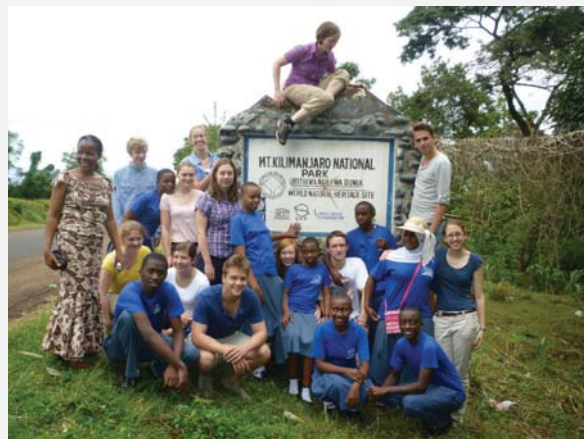
Gruppenfoto Dialogprojekttteam „Collecting and Connecting Histories“