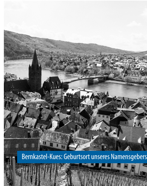
Bernkastel-Kues: Geburtsort unseres Namensgebers