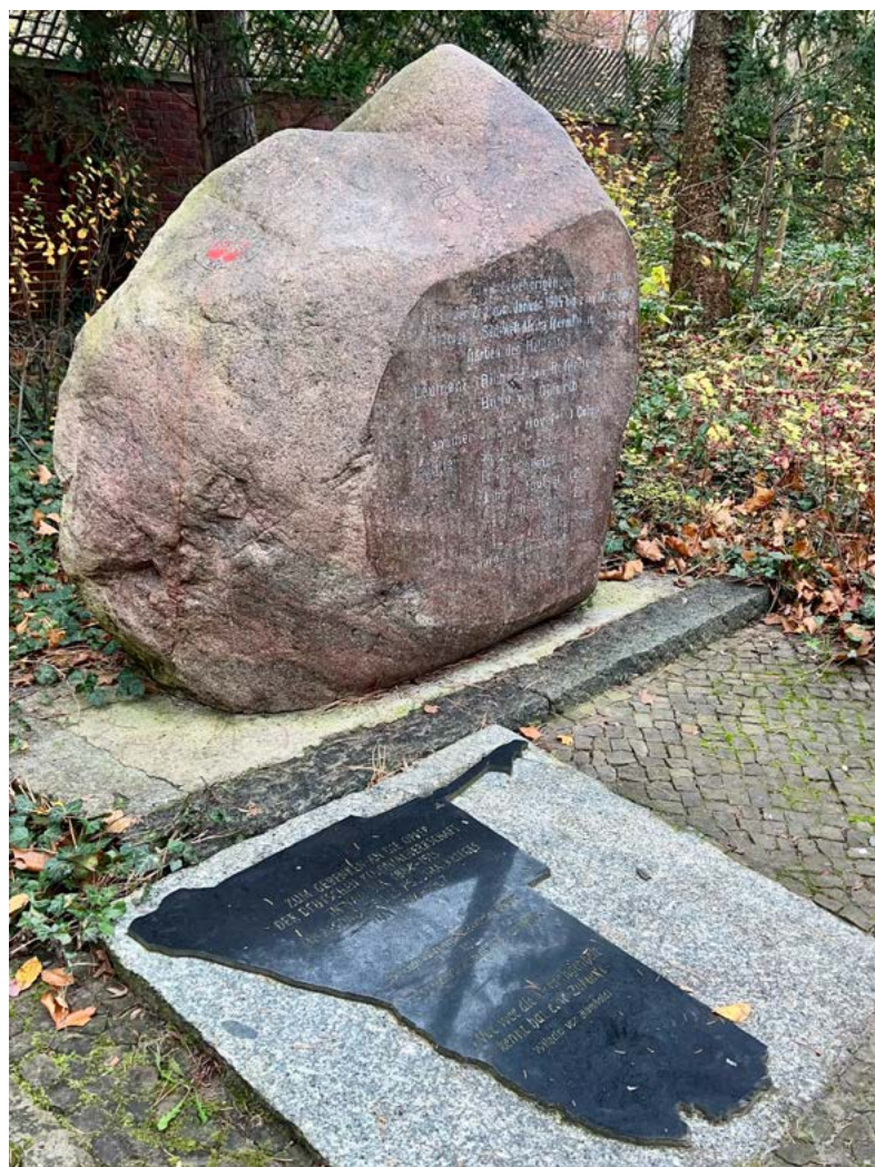
Der „Herero-Stein“ auf dem Friedhof am Columbiadamm (ehem. Garnisonfriedhof)

Das Unterrichtsbeispiel ist modular aufgebaut und kann entsprechend den schulischen Voraussetzungen angepasst werden. Die dazugehörigen Unterrichtsmaterialien sowie eine Reihenübersicht stehen über die aufgeführten Links bzw. abgebildeten QR-Codes zum Download bereit.