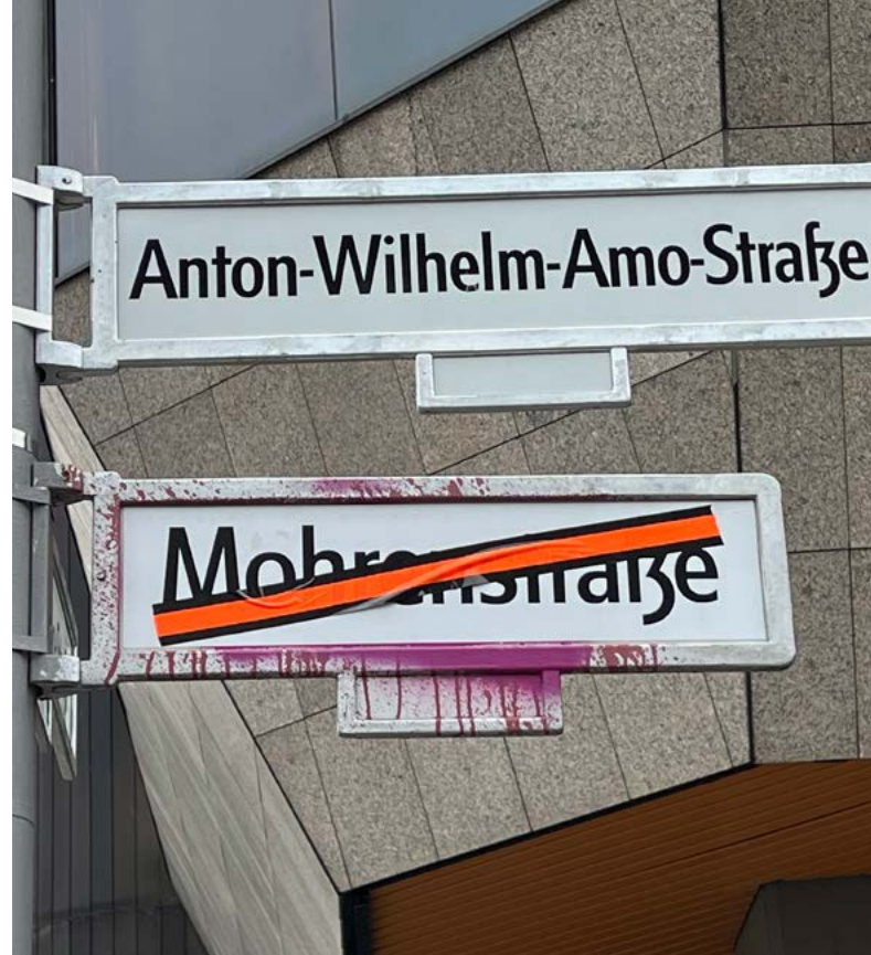
U-Bahnhofeingang Anton-Wilhelm-Amo-Straße

Im Rahmen dieses Bausteins werden die Teilnehmenden größtenteils eigenverantwortlich die vielschichtigen postkolonialen Dimensionen Berlins erkunden und kritisch reflektieren. Zu Beginn der Einheit wird die Bedeutung von Erinnerungskultur und wie sie in der Gesellschaft verankert ist diskutiert. Als Impuls dient ein Foto der umbenannten „M-Straße“ mit sichtbaren Farbbeutelattacken und ein knapper Vortrag der Lehrkraft zu den Hintergründen. Welche Erinnerungen werden in der Stadt sichtbar gemacht und welche bleiben im Verborgenen? Für die Durchführung der kritischen Stadtführung lassen sich Hilfsmittel empfehlen. Optional kann die Lehrkraft den Einsatz der App Actionbound 15 prüfen. Actionbound ist eine App für mobile Geräte,