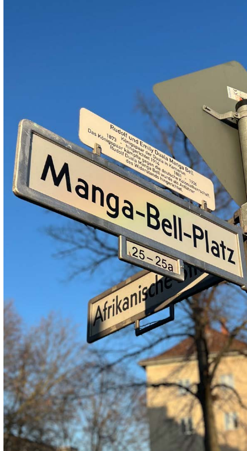
Afrikanisches Viertel

Der „Runde Tisch“ wird im Fish-Bowl-Format stattfinden, einer dynamischen und interaktiven Methode, die den Austausch von Ideen und Perspektiven fördert. Bei dieser Methode sitzen einige Schülerinnen und Schüler und Rollenvertreter in einem inneren Kreis und diskutieren aktiv, während die anderen im äußeren Kreis zuhören. Das Besondere am Fish-Bowl ist die Flexibilität und Lebendigkeit 17 .