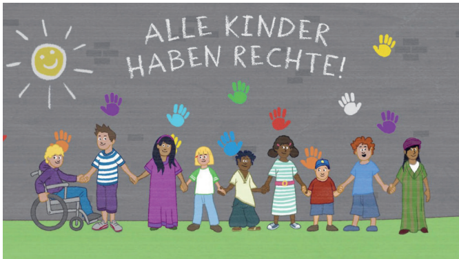
Illustration: Kindermissionswerk / Thomas Flachs

Unser Bound besteht aus verschiedenen Quizfragen (Multiple-, Single-Choice, Schätz- und „ja/nein“-Fragen) und Informationsseiten. Thematisch liegt der Schwerpunkt auf dem Thema Kinderarbeit, unter Berücksichtigung der Kinderrechte.