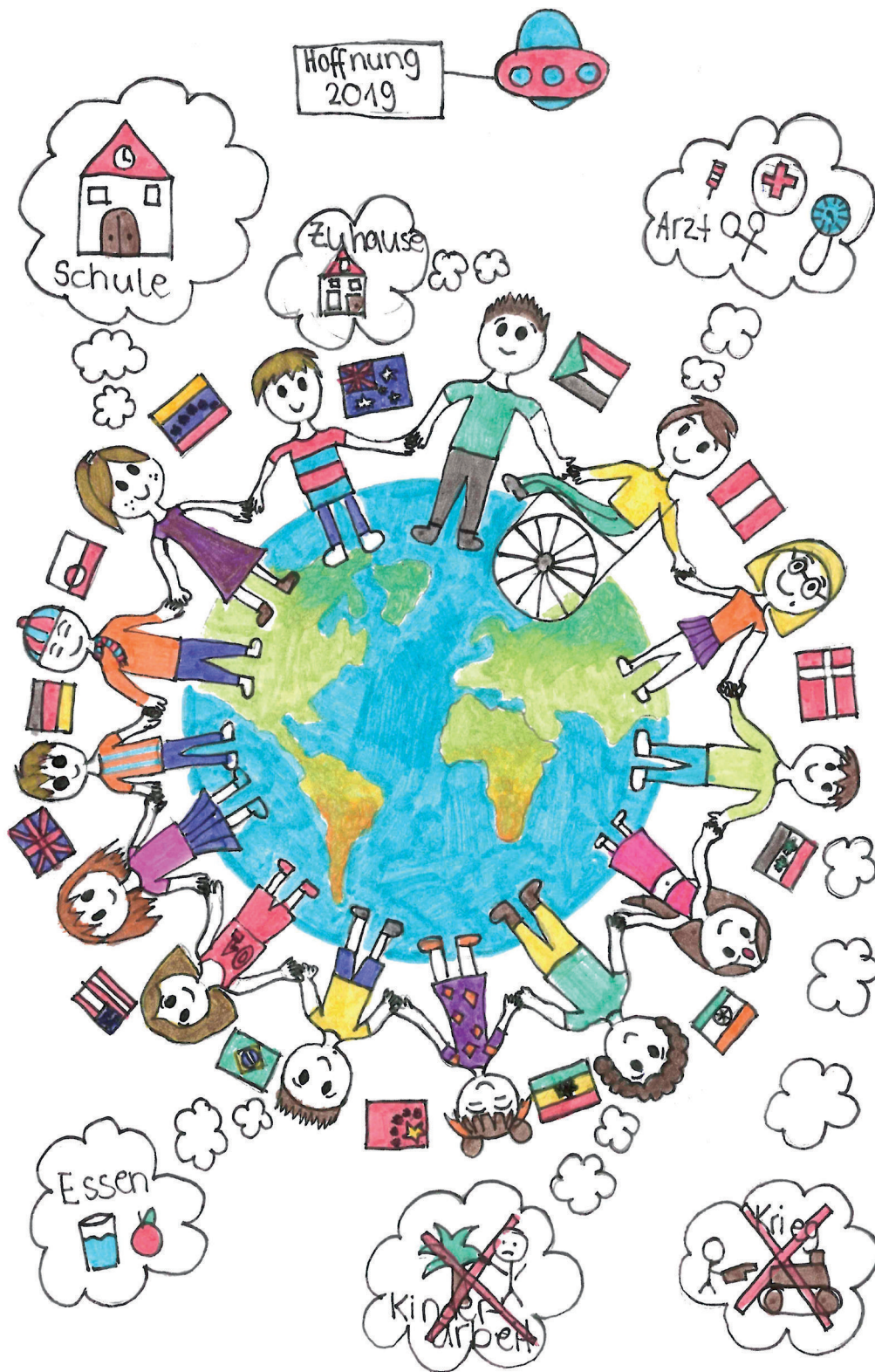
Rieke, 12 Jahre, Melle