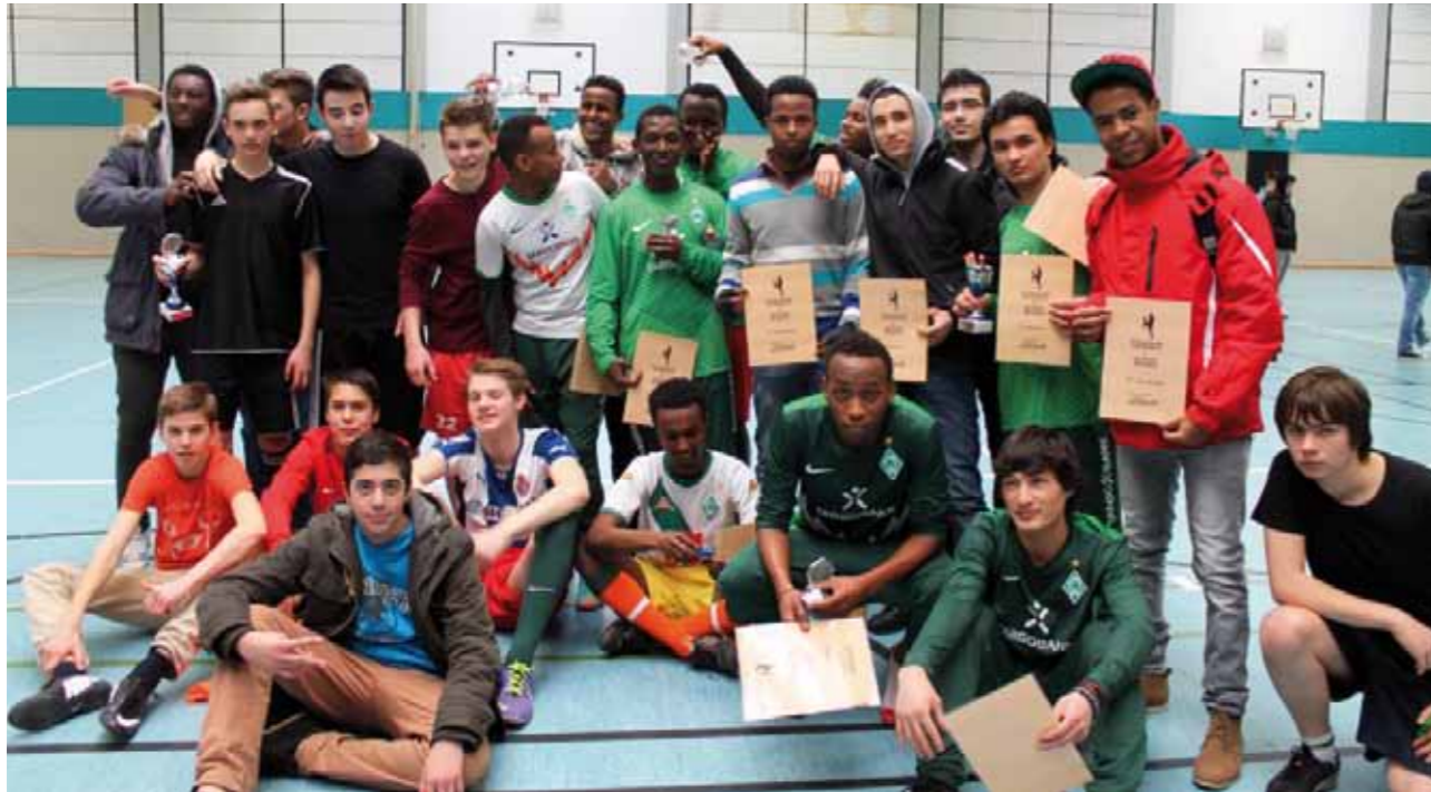
Die Teilnehmenden des Fußballturniers.