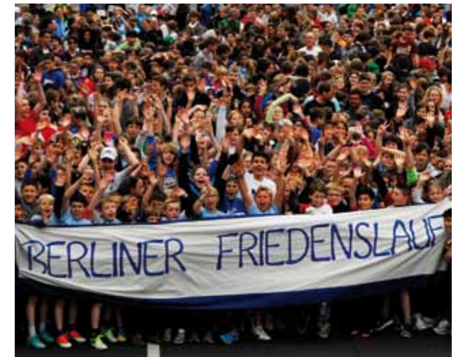
Mehr als 2000 Kinder starten beim Berliner Friedenslauf.