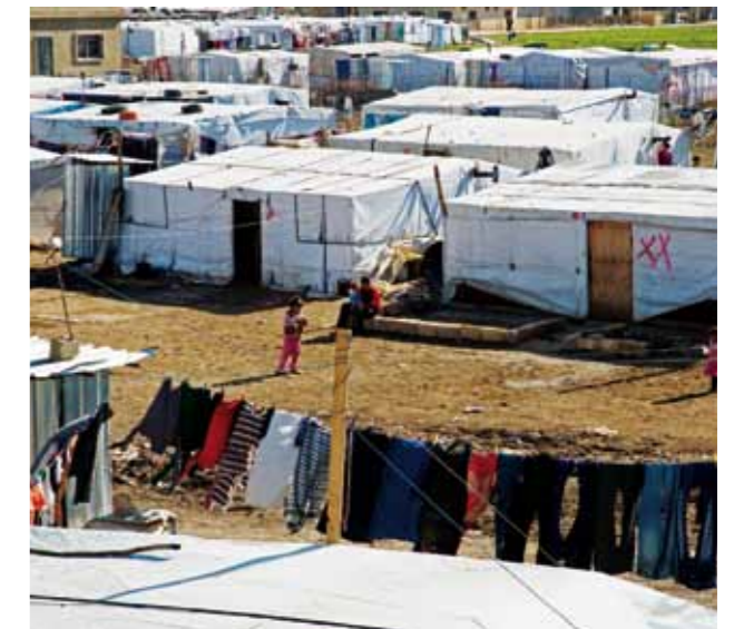
Es gibt im Libanon keine offiziellen Flüchtlingslager für syrische Flüchtlinge. Viele leben in informellen Zeltlagern, wie an diesem Ort im Bekaa-Tal.