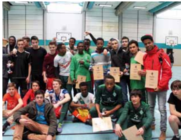
Die Teilnehmenden des Fußballturniers.