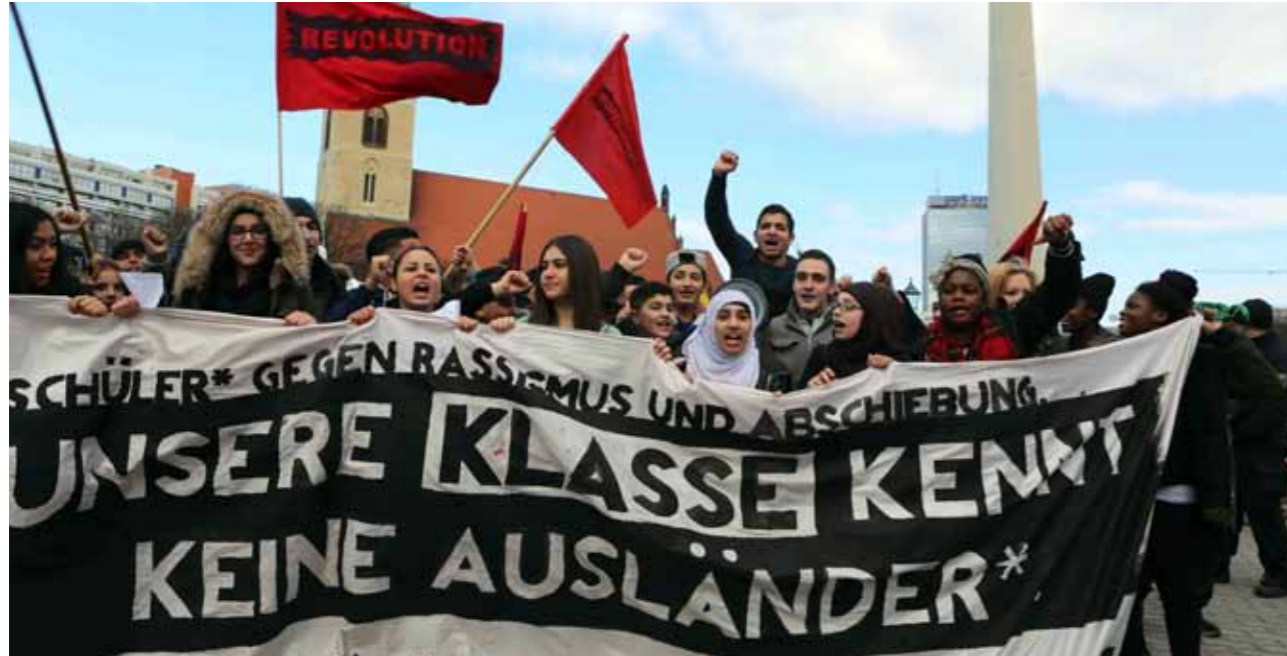
Wie in Hamburg, demonstrieren auch in Berlin immer wieder Schüler/innen für die Rechte von Geflüchteten und gegen ihre Abschiebung.