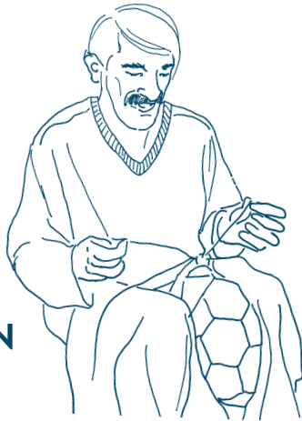
PRODUKTION DER BÄLLE