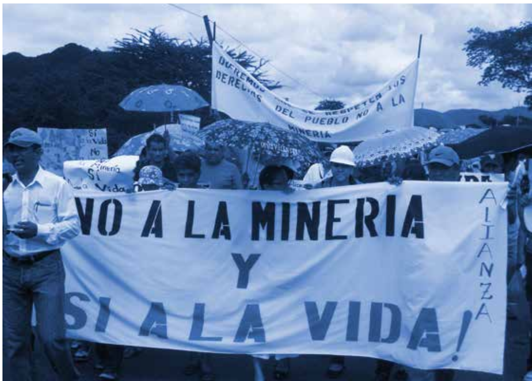
„¡NO a la minería y SÍ a la vida!“ Manifestación en Honduras.

Por medio de fotos de minas a cielo abierto y de protestas sociales se reflexiona sobre los costos de la minería en las poblaciones y el medio ambiente.