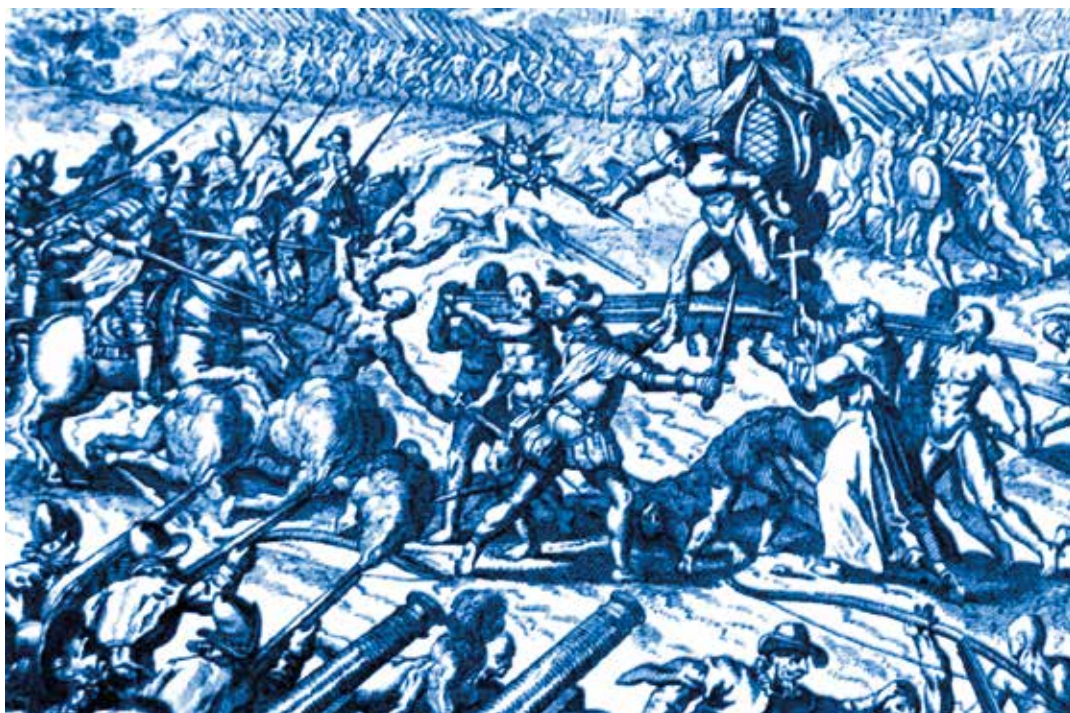
Las tropas de Francisco Pizarro en la captura del Inca Atahualpa, durante la batalla de Cajamarca/Perú 1532.