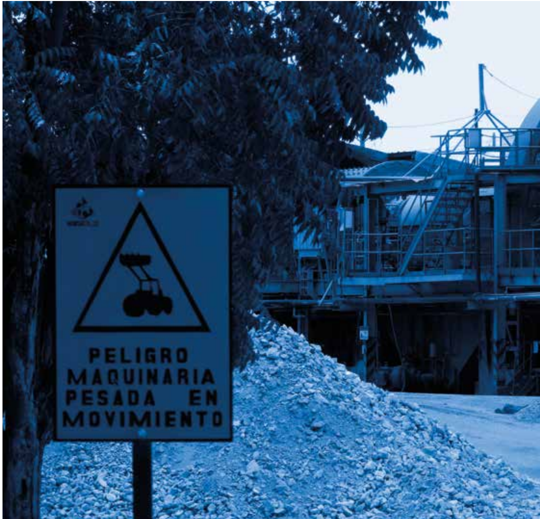
Planta de procesamiento de oro, mina El Limón/Nicaragua.