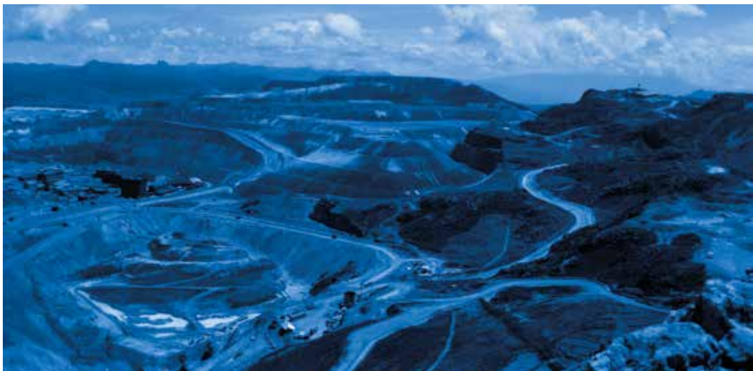
Minería de oro a cielo abierto, mina de Yanacocha en Cajamarca/Perú.

Hoy en día, como hace siglos, la minería representa para unos una bendición y para otros una maldición.