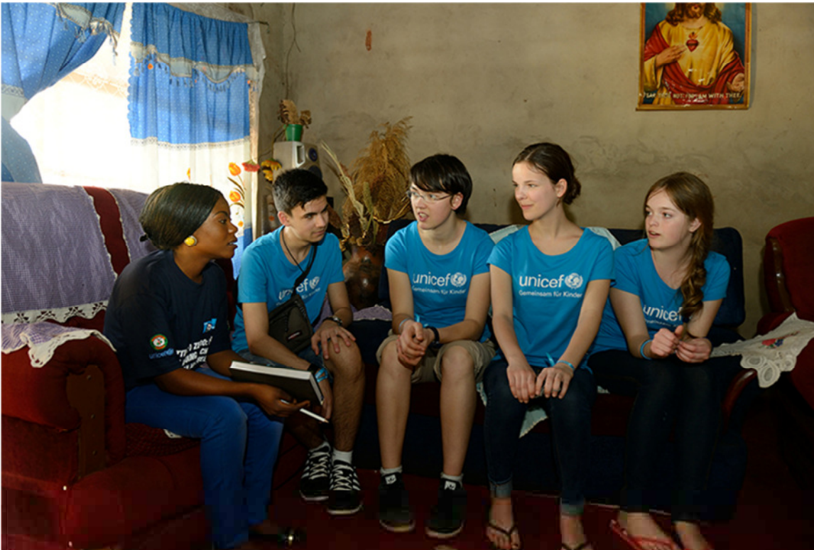
Im Wohnzimmer der Familie tauschen sich Dorica und die vier Junior-Botschafter über ihre Projekte aus.